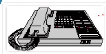
Vers téléphone fixe, portable, Dect etc ....